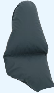
Rechts: zijkussen t.b.v. peervormige lichaamsvorm