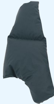
Links: standaard zijkussen

De standaard zijkussens in de Kelvin kunnen optioneel vervangen worden door deze 'peervormige zijkussens' om optimale zitondersteuning te bieden. Bij een nieuwe bestelling maak je gelijk de keuze uit standaard of peervormige zijkussens. Tevens zijn ze onderling uitwisselbaar.