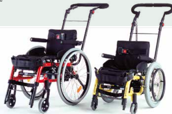
Levo LCEV Junior