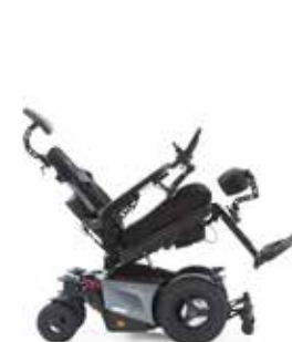
Inclinaison : 0 - 50°

Pour plus de spécifications, voir le diagramme à la page 22.