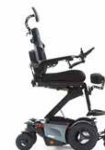
Assise à hauteur des yeux