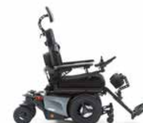
Repose-jambes central réglable