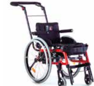
Levo LCEV Junior