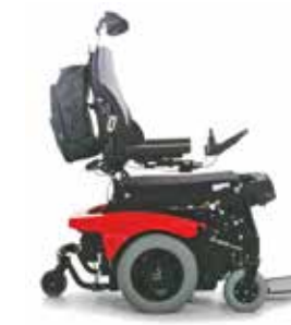
Levo Combi Junior