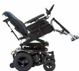
Inclinaison : 0 - 50°