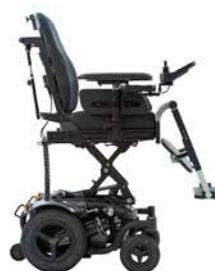
Fonction lift : 30 cm