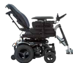
Repose-jambes séparés réglables