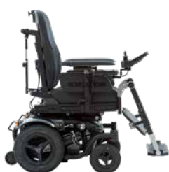
Position d'assise basse