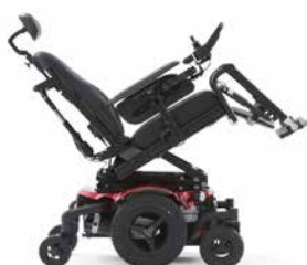
Inclinaison : 0-30°