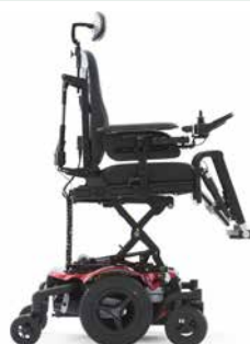
Fonction lift : 30 cm