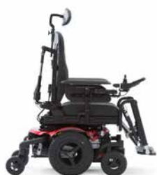
Position d'assise basse