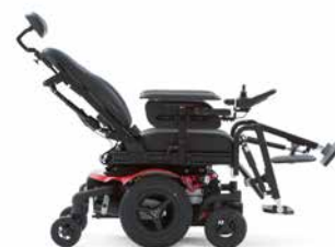
Repose-jambes séparés réglables