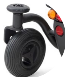
Bumpers pare-chocs sur roue arrière