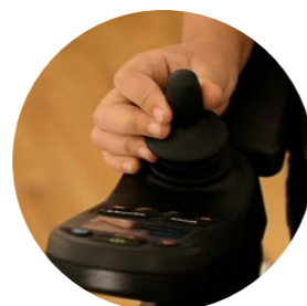
Système de commande intuitif