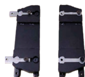
Armlehnen 25 mm seitlich verstellbar